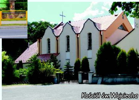
Kościół św. Wojciecha