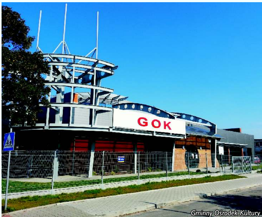
Gminny Ośrodek Kultury