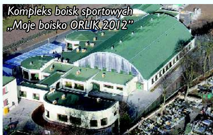
Kompleks boisk sportowych „Moje boisko ORLIK 2012”