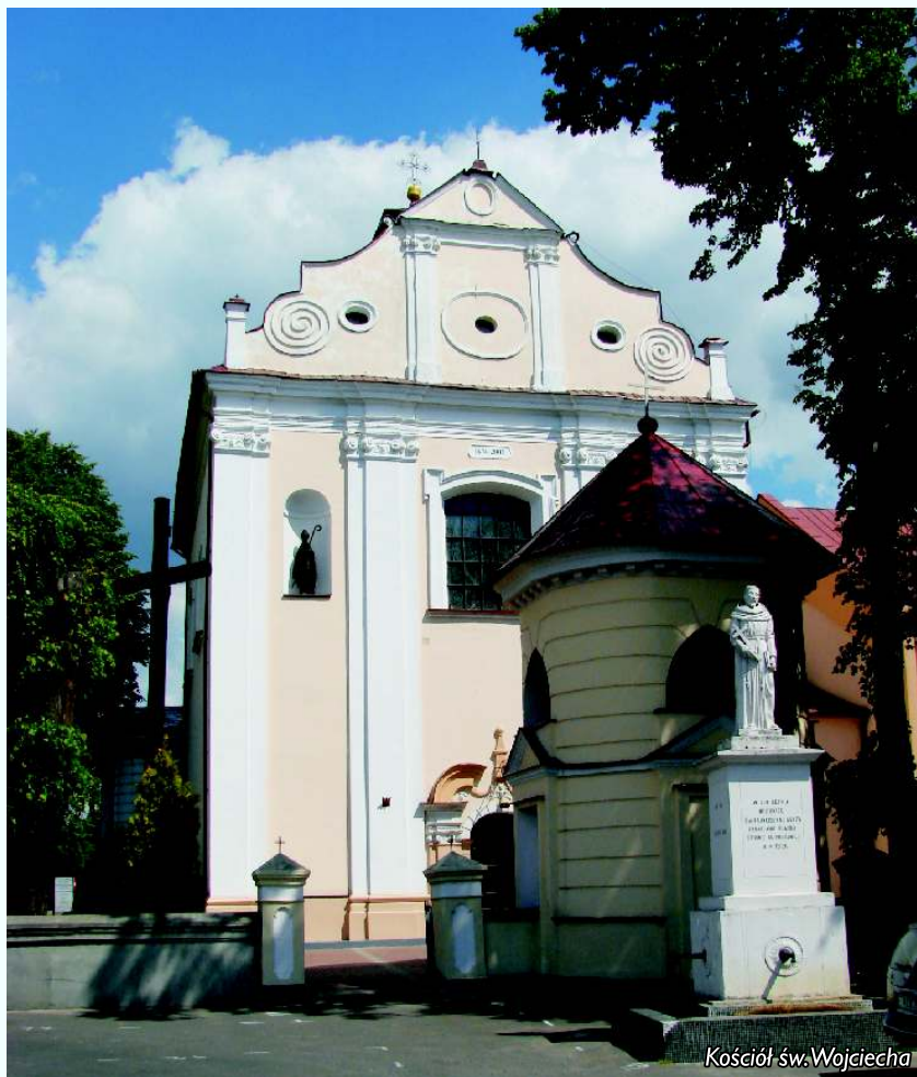
Kościół św. Wojciecha

• Kaplica cmentarna pw. św. Anny stoi na miejscu pierwszego drewnianego kościoła sprzed 1429 r. (i być może nawiązuje do niego swoją konstrukcją), rozebranego w 1794 r. W obecnej formie zbudowana została w latach 30. XIX wieku. W pobliżu kaplicy zachowały się rzeźbione nagrobki z połowy XIX wieku.