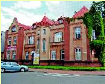
Eklektyczny magistrat z 1909 r.