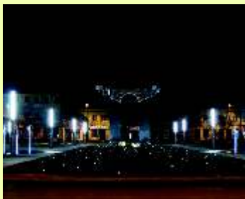
Plac 11 Listopada

Szlak rowerowy pod nazwą „Osady Braci Czeskich” powstał dla upamiętnienia 200. rocznicy osiedlenia się na tych terenach Czechów. Szlak rozpoczyna się w Łasku, dalej wiedzie przez Barycz, Talar, Rokitnicę, Gucin, Grzeszyn, Zabłoty, Bocianicę, Zelówek, Zelów, Krześłów, Faustynów. Najciekawsze miejscowości znajdujące się na trasie tego szlaku to m.in.: Rokitnica – w XIX w. była wsią zamieszkiwaną głównie przez kolonistów niemieckich. Obecnie jest miejscowością letniskową. Na jej terenie istnieje ponad 600 działek letniskowych. Grzeszyn to miejscowość, w której na początku ubiegłego stulecia wzniesiono budynek fabryczny. Mieściły się w nim przędzalnia, tkalnia, farbiarnia oraz magazyny. Nieopodal tego budynku w parku stoi willa, pobudowana w stylu modernizmu niemieckiego. Zabłoty – wieś zasiedlona w XIX w. przez osadników niemieckich. Do dnia dzisiejszego w miejscowości tej zachował się niewielki cmentarz ewangelicko-augsburski z kilkoma nagrobkami. Faustynów – wieś, w której 160 lat temu osiedlili się potomkowie czeskich emigrantów. W czasach II wojny światowej w pobliżu tej miejscowości przebiegała linia obrony. Po tamtych wydarzeniach nieopodal tej wsi pozostał polski bunkier „Grom”.