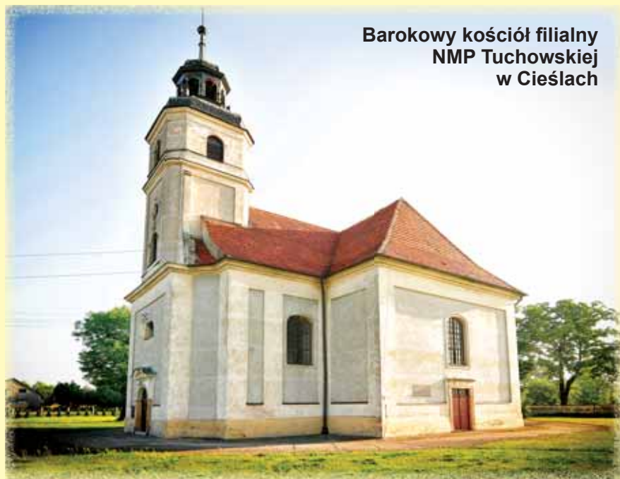
Barokowy kościół filialny NMP Tuchowskiej w Cieślach

Na cmentarzu przykościelnym, przy południowo-zachodnim narożniku znajduje się mały nagrobek z tablicą o treści: „Prochy żołnie-