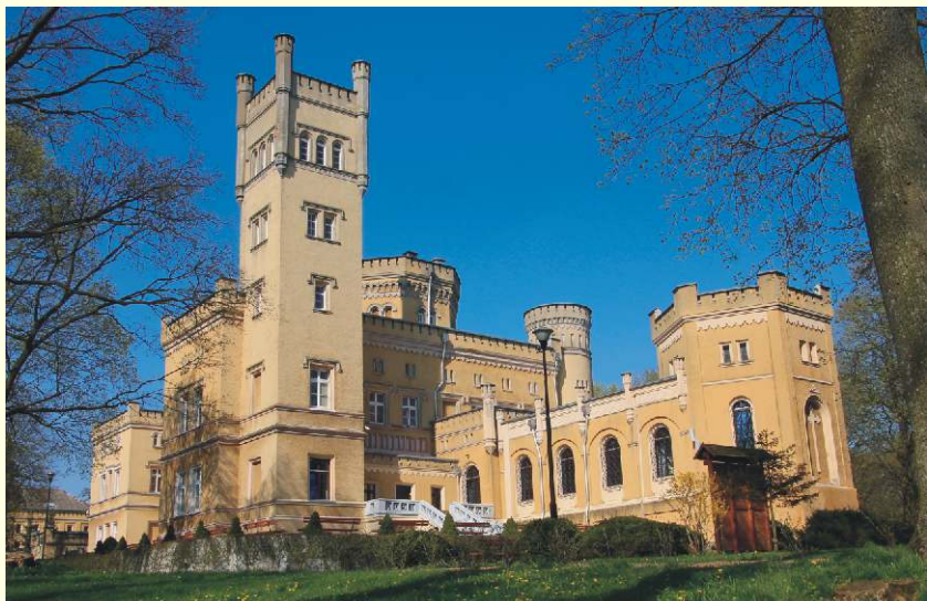
↓ Pałac Narzymskich - Wzgórze Bł. Marii Karłowskiej

pomorskie i warmińsko-mazurskie. Linie te zapewniają dogodny połączenie Miasta i Gminy Jabłonowo Pomorskie z regionami kraju i większymi miastami województwa.