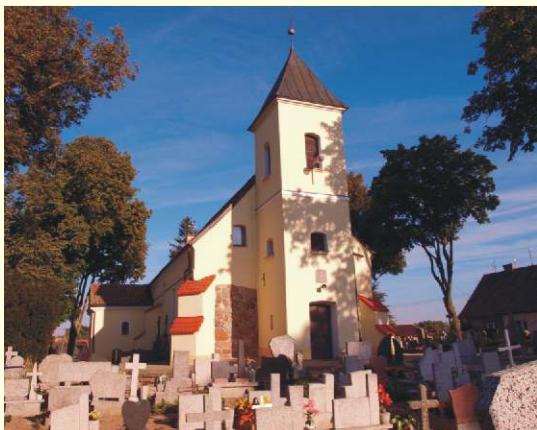
Kaplica Bł. Marii Karłowskiej