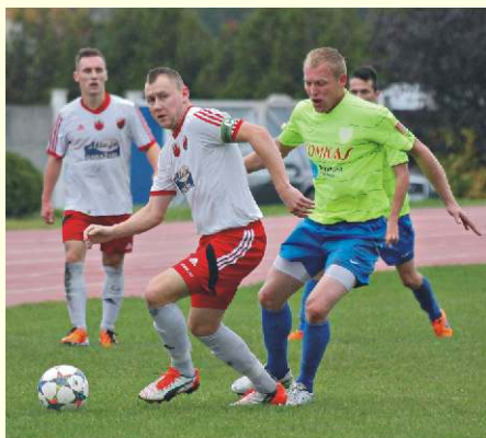
→ LKS Naprzód Jabłonowo (zielone koszulki)