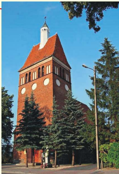
Kościół pw. świętego Wojciecha

Struktura przestrzenna sieci drogowej Miasta i Gminy Jabłonowo Pomorskie jest bardzo dobrze rozwinięta, a najważniejszym jej elementem jest droga wojewódzka nr 543. Pozostałą sieć drogową stanowią drogi powiatowe i gminne. Droga wojewódzka nr 543, przechodząca przez Gminę Jabłonowo Pomorskie, umożliwia dogodne połączenia zewnętrzne. Na obszarze gminy ma długość 11,939 km, co stanowi 5,76% ogólnej długości dróg. Tą drogą można dojechać do Brodnicy, która jest miastem powiatowym i jest oddalona od Jabłonowa Pomorskiego o 23 kilometry, w odległości 35 kilometrów znajduje się miasto Grudziądz, a 80 kilometrów od Jabłonowa położone jest miasto piernika, siedziba Urzędu Marszałkowskiego Województwa Kujawsko-Pomorskiego – Toruń. Najbliższy zjazd na autostradę A1 znajduje się 50 kilometrów od Jabłonowa Pomorskiego – w Lisewie.