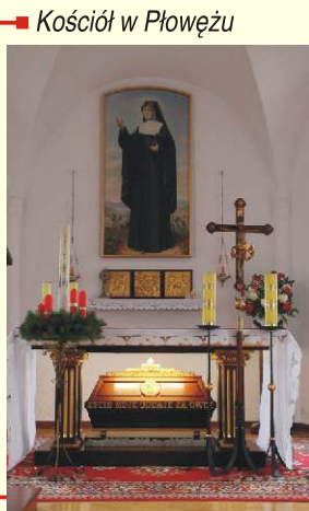
→ Kościół w Płowężu