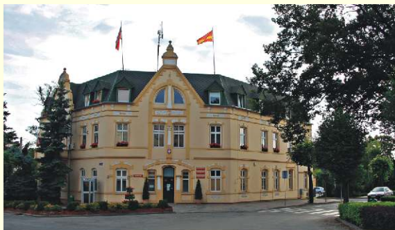
Urząd Miasta i Gminy