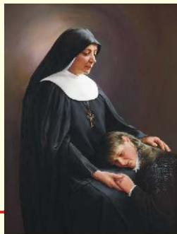
Błogosławiona Matka Maria Karłowska - patronka miasta

Miasto i Gmina Jabłonowo Pomorskie znajduje się w północno-centralnej części Polski, w województwie kujawsko-pomorskim, w powiecie brodnickim. Położone jest na Pojezierzu Chełmińskim, nad rzeką Lutryną, a powstało w wyniku połączenia ze sobą wsi: Jabłonowo i Sadlinki.