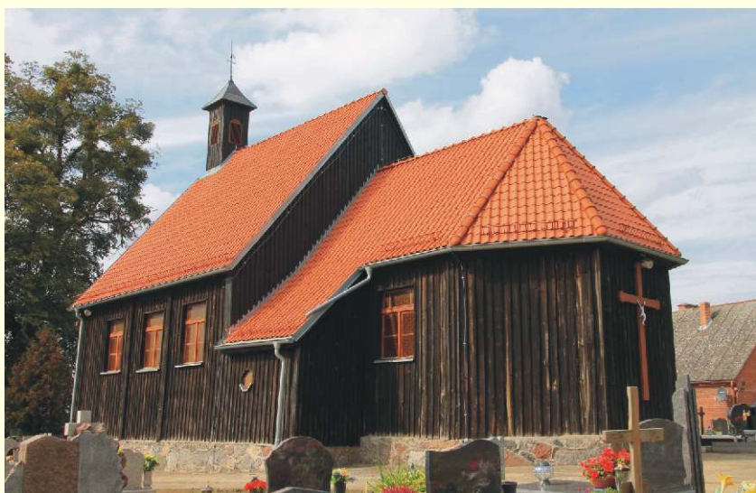
Kościół w Góralach

Jabłonowo jest siedzibą gminy miejsko-wiejskiej. Od 1962 roku posiada prawa miejskie. Gmina Jabłonowo Pomorskie liczy 9514 mieszkańców, z czego w mieście zamieszkuje 3893 osoby, a w gminie 5621 osób.