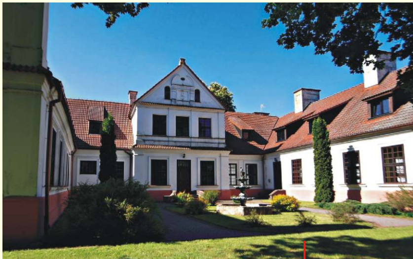
↓ Dworek w Nowej Wsi