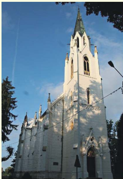
Kościół pw. Chrystusa Króla

Pod względem przyrodniczym cały obszar gminy znajduje się w granicach „Zielonych Płuc Polski”. Wschodnia część obszaru gminy mieści się w granicach Brodnickiego Parku Krajobrazowego, do którego przylegają obszary chronionego krajobrazu „Obszar doliny Osy i Gardęgi” oraz „Obszar doliny Drwęcy”.