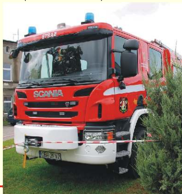
→ Wóz strażacki typu GCBA

W 2017 roku Ochotnicza Straż Pożarna w Jabłonowie Pomorskim przeszła generalną termomodernizację oraz otrzymała nowoczesny, świetnie wyposażony wóz typu GCBA – ciężki samochód gaśniczy ze zbiornikiem wodnym i autopompą. Także w Centrum Kultury i Sportu w Jabłonowie Pomorskim przeprowadzona została termomodernizacja, która polegała na dociepleniu stropu nad piwnicą, ścian zewnętrznych nadziemna, stropodachu, dachu skośnego, ścian fundamentowych i cokołowych, posadzki na sali widowiskowej oraz na dociepleniu ścian zewnętrznych lewego skrzydła.