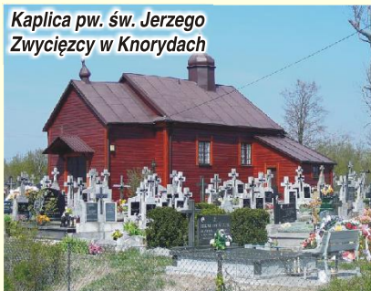
Kaplica pw. św. Jerzego Zwycięzcy w Knorydach