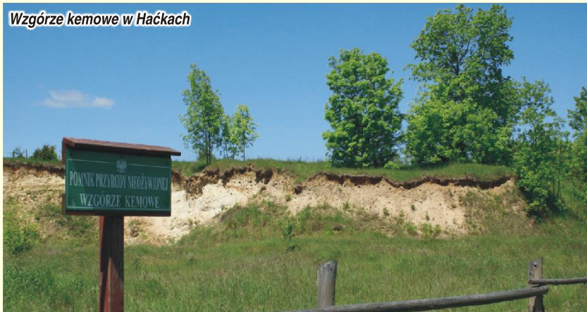
Wzgórze kemowe w Haćkach

Nie zdewastowane ekologicznie położone na obszarze „Zielonych płuc Polski” okolice, jak i też sam teren gminy, posiadają autentyczne walory rekreacyjne i turystyczne. Dolina Górnej Narwi jest jedną z najlepiej zachowanych dolin