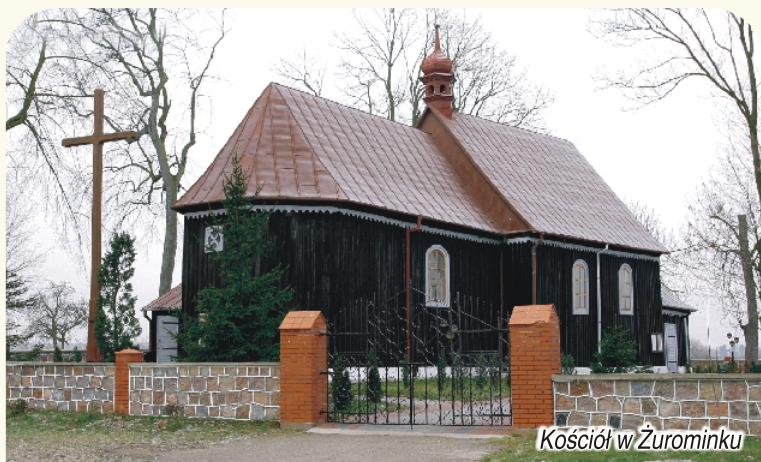
Kościół w Żurominku