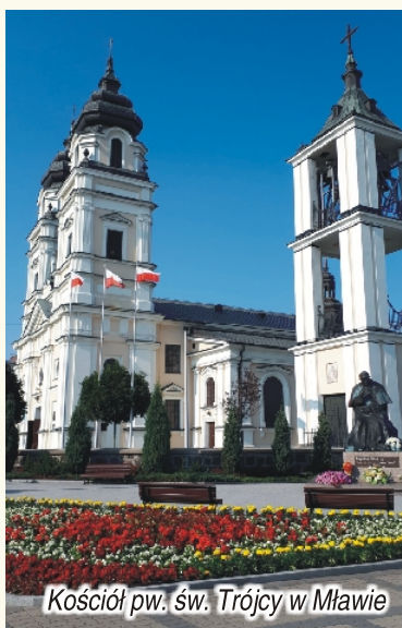
Kościół pw. św. Trójcy w Mławie