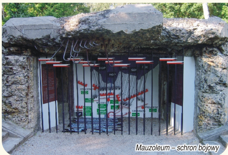
Mauzoleum – schron bojowy