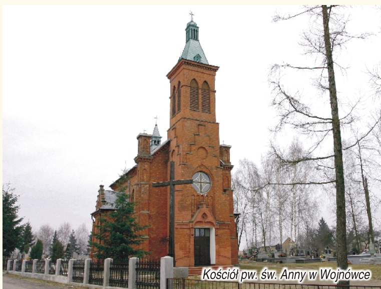
Kościół pw. św. Anny w Wojnowce