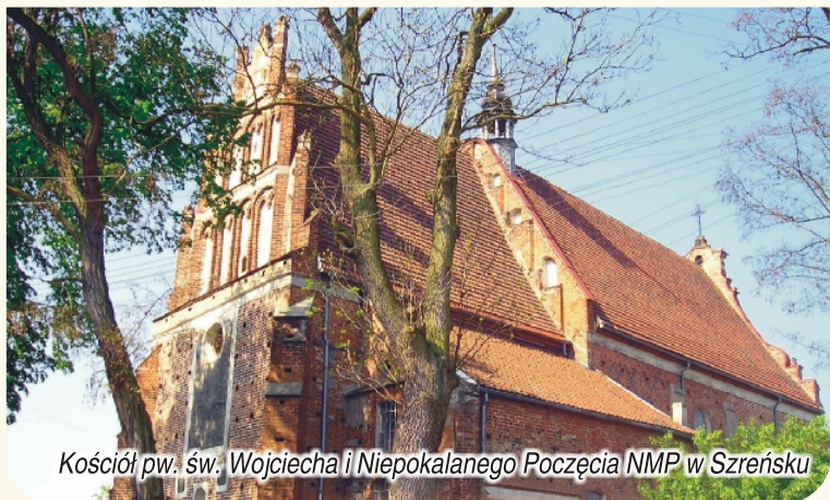
Kościół pw. św. Wojciecha i Niepokalanego Poczęcia NMP w Szreńsku