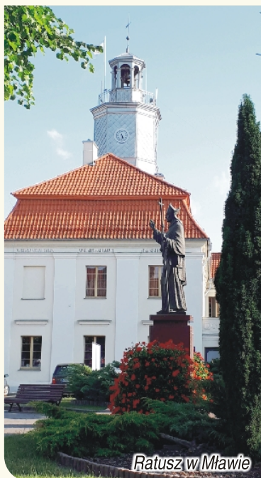
Ratusz w Mławie