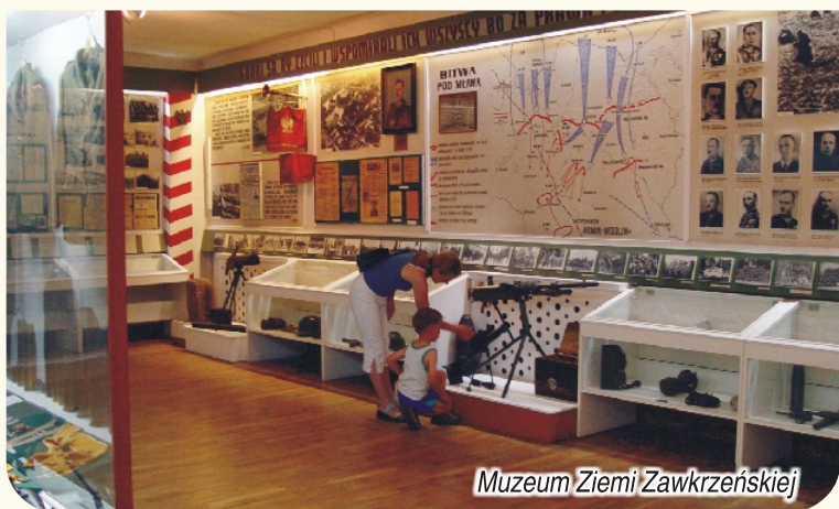
Muzeum Ziemi Zawkrzeńskiej