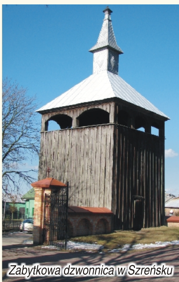
Zabytkowa dzwonnica w Szreńsku