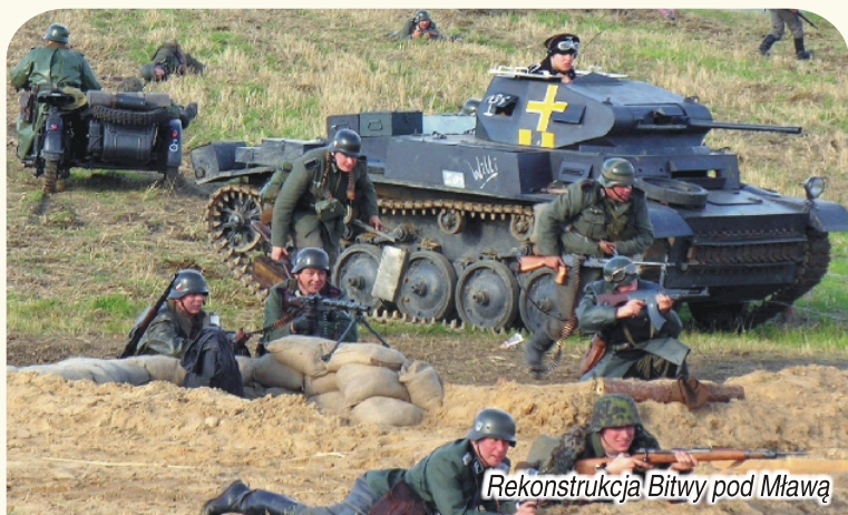
Rekonstrukcja Bitwy pod Mławą