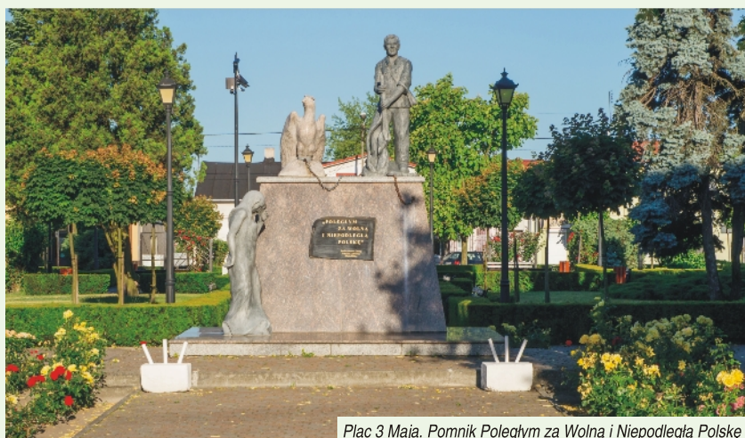
Plac 3 Maja. Pomnik Poległym za Wolną i Niepodległą Polskę