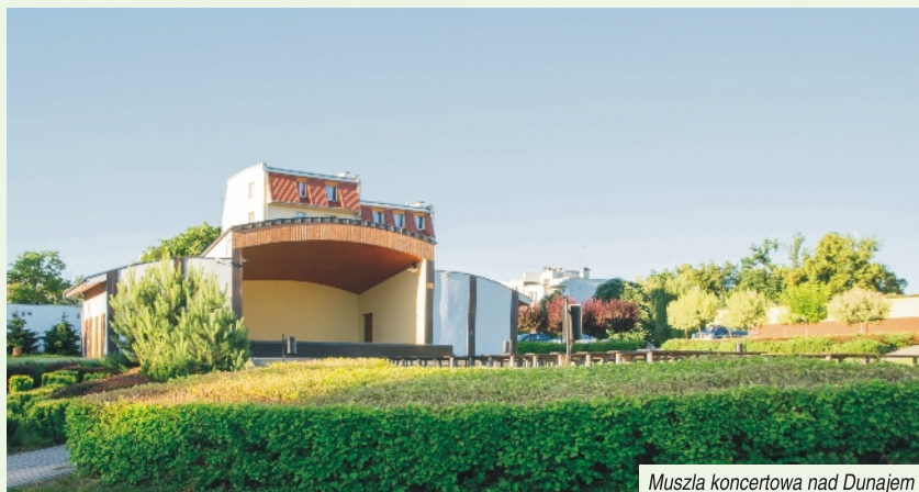
Muszla koncertowa nad Dunajem