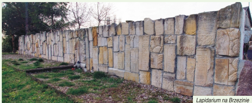
Lapidarium na Brzezynie