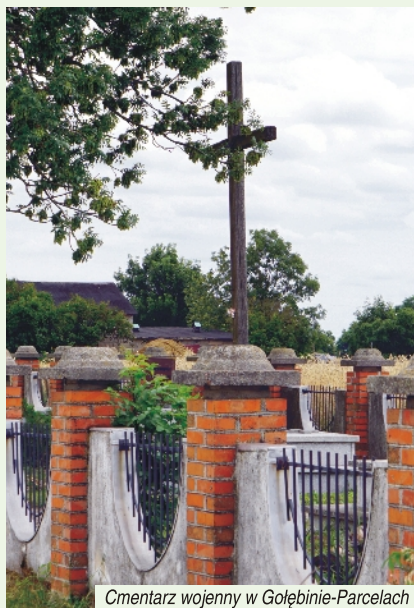
Cmentarz wojenny w Gołębiniu-Parcelach