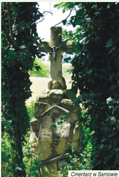
Cmentarz w Sarnowie