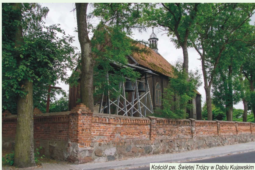
Kościół pw. Świętej Trójcy w Dąbiu Kujawskim