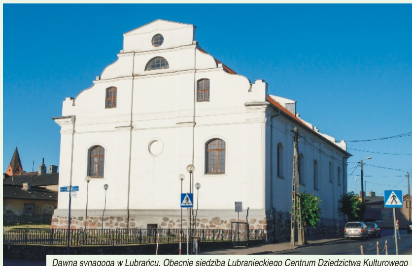
Dawna synagoga w Lubrańcu. Obecnie siedziba Lubrańskiego Centrum Dziedzictwa Kulturowego