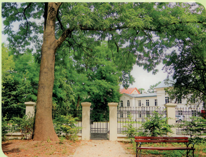
PARK MIEJSKI I PAŁAC F. SCHLÖSSERA W OSZKÓWIE

Centralne miejsce miasta stanowi Plac Jana Pawła II, przy którym znajdują się liczne XIX-wieczne kamienice i barokowy kościół parafialny św. Józefa (z 1668 r., przebudowany w XIX i XX w.). Stąd łatwo trafić do XIX-wiecznego kościoła ewangelicko-augsburskiego pw. Dwunastu Apostołów (ul. Zgierska 2). Ponadto w tym mieście o bogatych tradycjach przemysłowych warto zobaczyć pałace fabrykantów – klasycystyczny Fryderyka Schlössera (ul. Listopadowa 6 – siedziba Młodzieżowego Domu Kultury i Miejskiej Biblioteki Publicznej) oraz Henryka Schlössera (ul. Łęczycka 3, własność prywatna). Do spacerów nad Bzurą zachęca zrewitalizowany Park Miejski, a zalew Starówka z sezonowym kąpieliskiem jest popularnym miejscem rekreacji. Skarbnicą wiedzy historycznej jest Izba Historii Miasta Ozorkowa prowadzona przez Towarzystwo Przyjaciół Ozorkowa w MDK w Ozorkowie (ul. Listopadowa 6B, tel. 48 42 718 93 53).