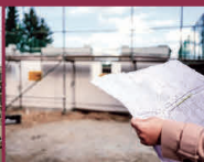
budowa domów jednorodzinnych