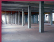
budowa małych hal i magazynów