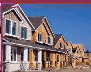
budowa domów wielorodzinnych