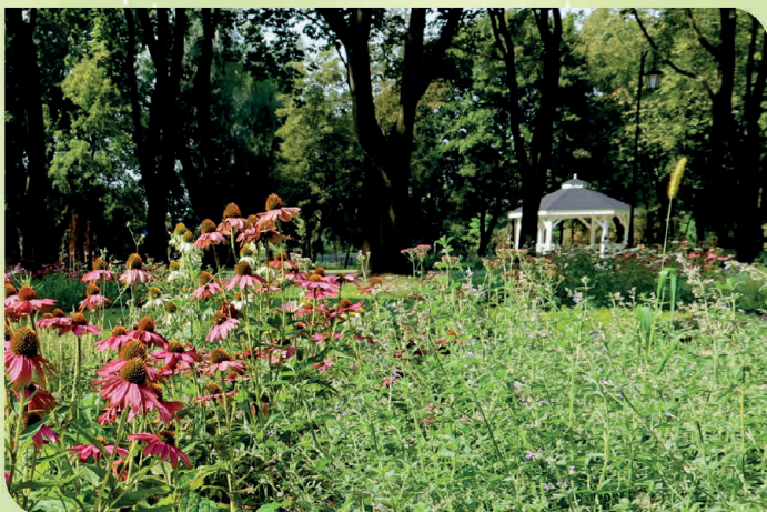
PARK MIEJSKI W ZGIERZU

Gminę Zgierz charakteryzuje duże zróżnicowanie terenu i piękne krajobrazy. Znajdują się tutaj rezerваты przyrody: Ciosny, Dąbrowa Grotnicka, Grądy nad Lindą i Grądy nad Moszczenicą, a także objęte ochroną parki podworskie w: Dzierżaznej, Kęblinach, Jeżewie, Lućmierzu i Glinniku. Na terenie gminy warto zobaczyć drewniane kościoły z XVIII w.: św. św. Piotra i Pawła w Białej oraz Wszystkich Świętych w Giecznie. Dworek w Dzierżaznej jest siedzibą Gminnego Centrum Kultury, Sportu, Turystyki i Rekreacji oraz Gminnej Biblioteki Publicznej, w jego sąsiedztwie znajduje się zabytkowy park ze stawem, plac zabaw i łącznia (adres GCKSTiR: Dzierżazna 4, tel. 500 158 477, e-mail: dzierzazna@dierzazna.pl).